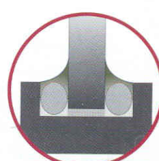
Sellado de vidrio