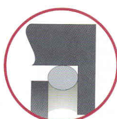
Junta de canto